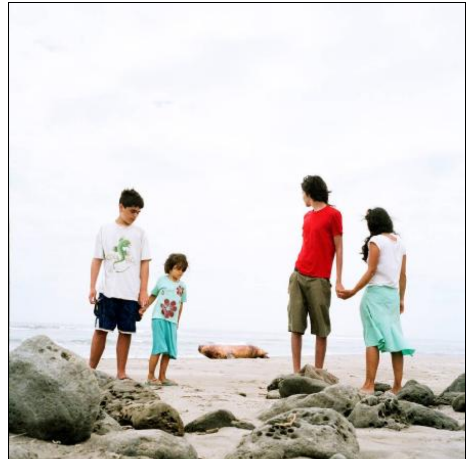
UR BOKEN "NAINI AND THE SEA OF WOLVES" AV TRINIDAD CARRILLO