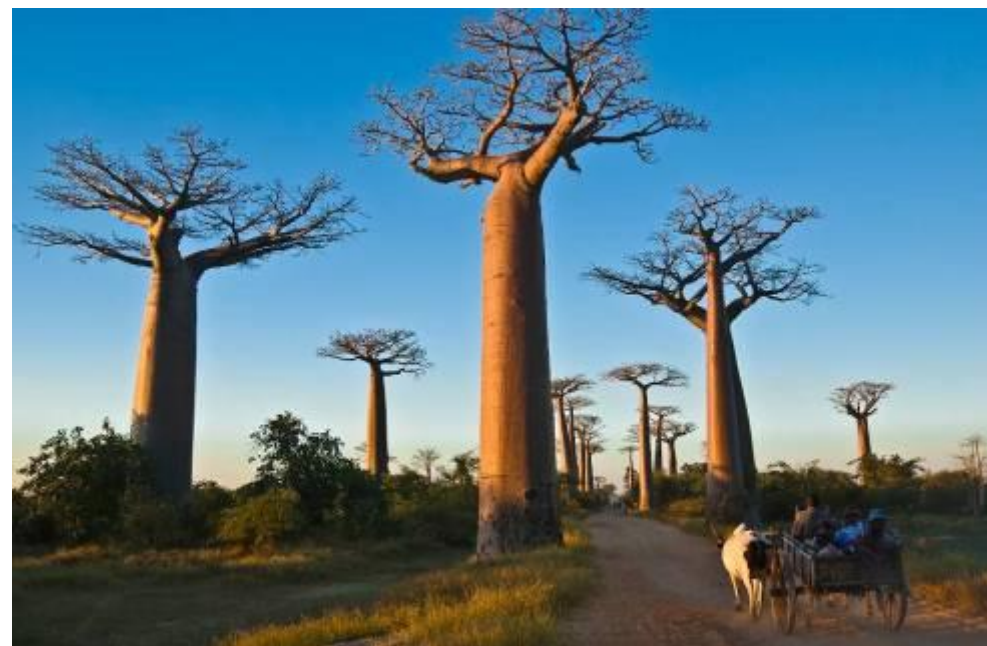
MADAGASCAR - AVENUE DES BAOBABS